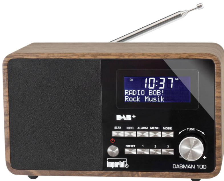
Model DABMAN 100