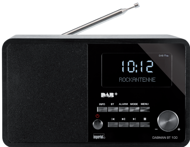
IMPERIAL DABMAN BT 100 DAB+ & FM Radio