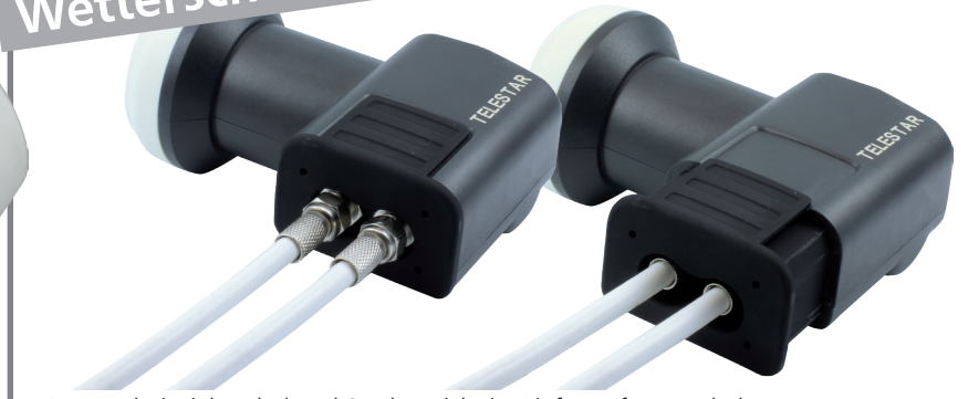
Montagebeispiel, Kabel und Stecker nicht im Lieferumfang enthalten

Durch den integrierten Wetterschutz schützen Sie Ihr Anschlusskabel! Einfach nach Montage des Koaxkabels Wetterschutzkappe nach unten ziehen.