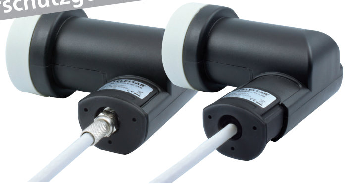
Montagebeispiel, Kabel und Stecker nicht im Lieferumfang enthalten

Durch den integrierten Wetterschutz schützen Sie Ihr Anschlusskabel! Einfach nach Montage des Koaxkabels Wetterschutzkappe nach unten ziehen.